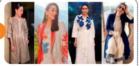
बेसिक कुर्ते से भी किएट किया...