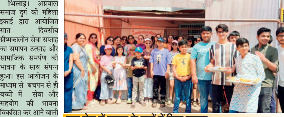
बाल सेवा में समाज के बच्चों में दिखा उत्साह