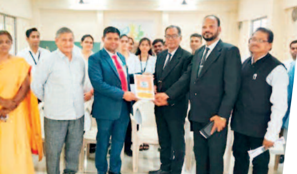
व्यावहारिक उदाहरणों के माध्यम से विद्यार्थियों को समझाया

दुर्ग। सेठ रतनचंद सुराना विधि महाविद्यालय में विद्यार्थियों के लिए आयोजित वैकल्पिक विवाद समाधान विषयक सेमिनार का द्वितीय दिवस सफलतापूर्वक संपन्न हुआ। इस अवसर पर जिला विधिक सेवा प्राधिकरण, दुर्ग के सचिव, लीगल एड डिफेंस काउंसिल सिस्टम के चीफ, अरिस्टेंट अधिवक्ता एवं मीडिएटर अधिवक्ता विशेष रूप से उपस्थित थे। सेमिनार के दौरान विशेषज्ञों द्वारा विद्यार्थियों को संविधान एवं वैकल्पिक विवाद समाधान की अवधारणा पर विस्तारपूर्वक जानकारी प्रदान की गई। उन्होंने बताया कि वैकल्पिक विवाद समाधान क्या है, किन परिस्थितियों में इसका उपयोग किया जाता है, इसकी आवश्यकता क्यों है तथा यह समाज एवं न्याय प्रणाली को किस प्रकार सुदृढ़ बनाता है।